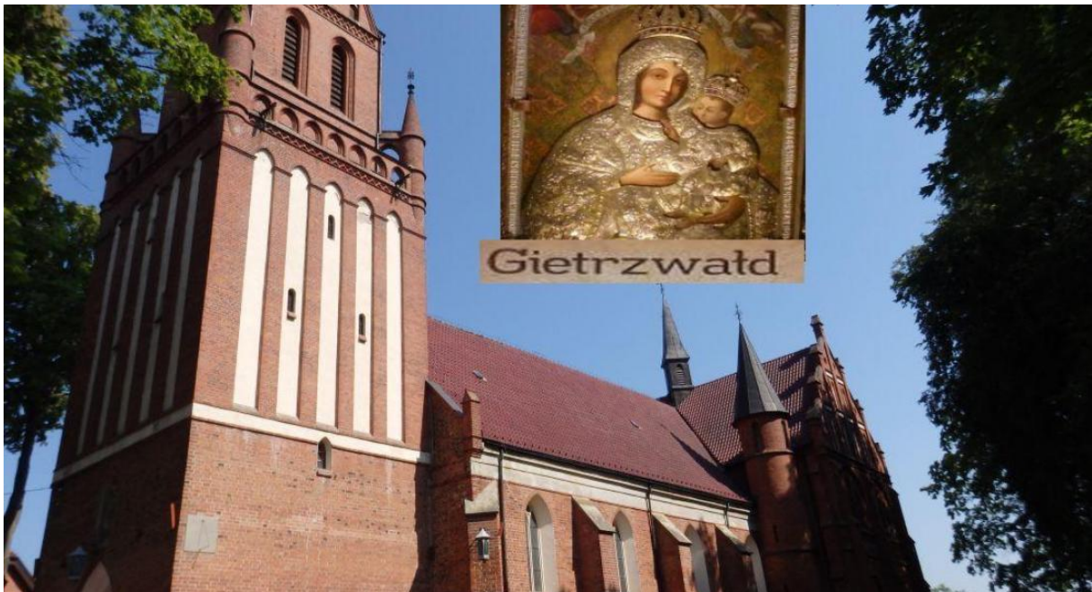
Lipka, gdzie znajdują się Jej obrazy lub figury.